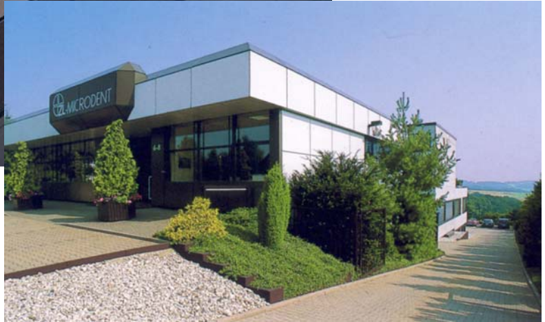
Das Firmengebäude in Breckerfeld.